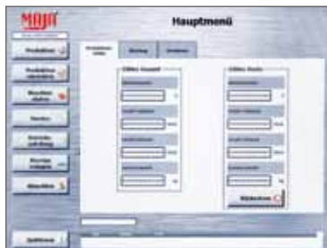
Display und Bedieneinheit: Benutzeroberfläche Touchscreen